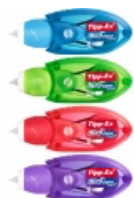
Blanco ou souris