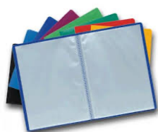
3 porte-vues A4 120 vues (bleu, rouge et vert)